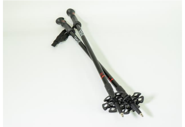
トレッキングポール

※スノーシューセットには装着用のシューズはついておりませんので、お客様自身でご用意していただく必要があります。(シューズの形状により装着できない場合があります。)