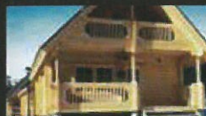
サンタハウス GETO TEL.0197-73-5050