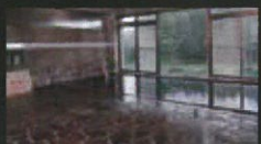
水神温泉湯元 東館 TEL.0197-73-7297