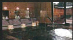
水神温泉 山照園 TEL.0197-73-6675