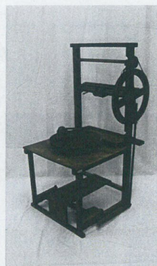
足踏み式座繰り器