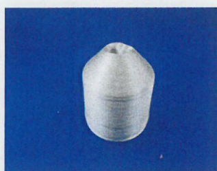
コ-ン巻きした絹糸 (絹べそ)

養蚕の歴史と蚕具を紹介した第77回企画展に引き続き、今回の企画展では、養蚕農家が“まゆ”から“生糸”を繰るために使用した道具と、糸繰り技術やシルクの特徴について紹介します。